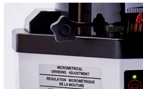
Regulation micrométrique de la mouture. Micro metrical grinding ajustement